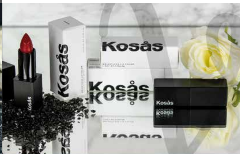
KOSÀS COSMETICS | L'ARTE DEL ROSSETTO, L'ANIMA DELLA SCIENZA