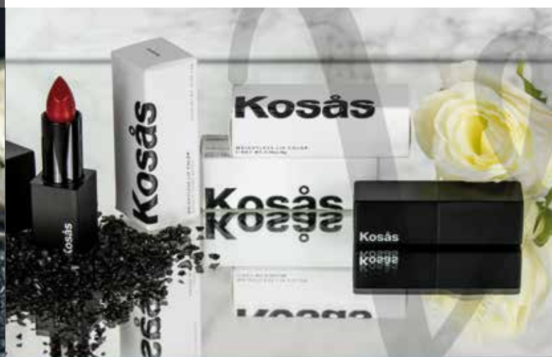
KOSÀS COSMETICS | L'ARTE DEL ROSSETTO, L'ANIMA DELLA SCIENZA