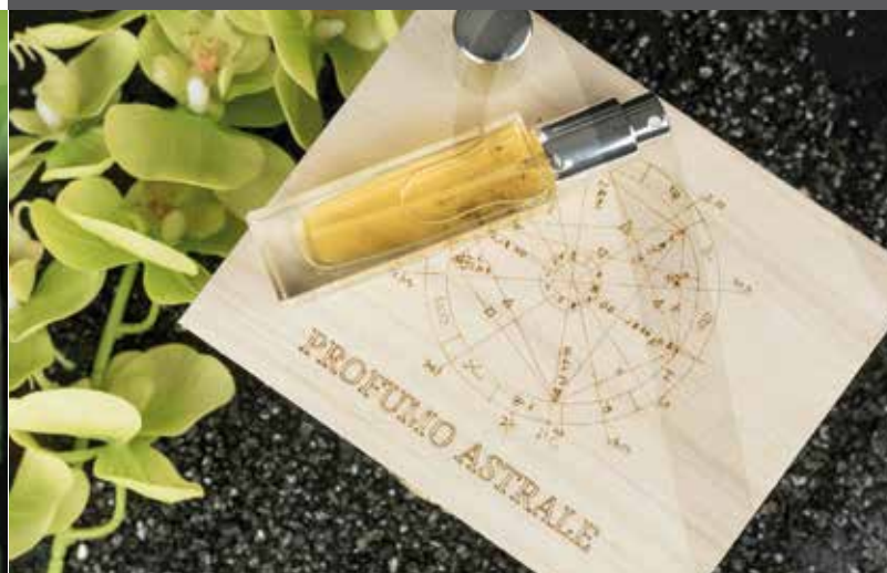
OLFATTIVA – IL PROFUMO DEL CIELO CHE CI HA VISTO NASCERE