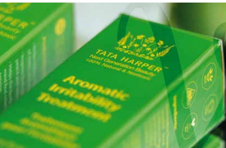
TATA HARPER POZIONI DI BELLEZZA PER LA NOSTRA ANIMA