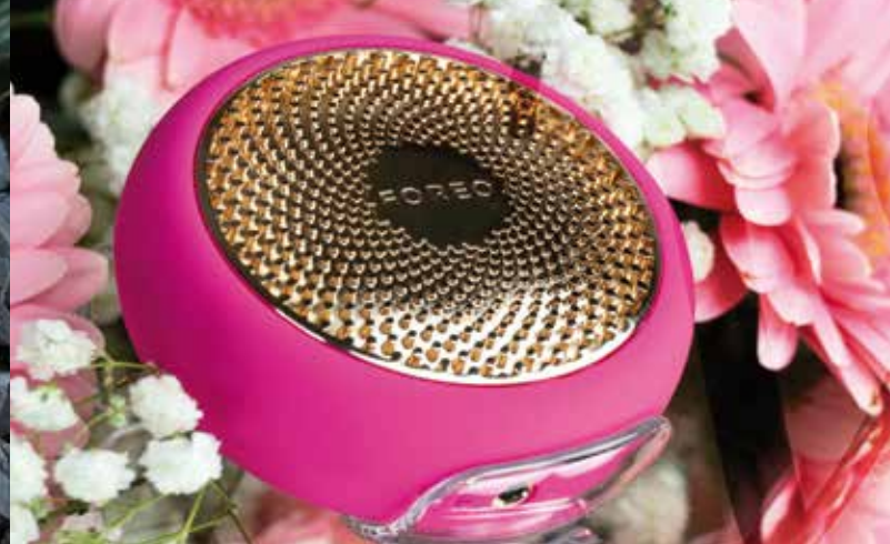
FOREO UFO | IL FUTURO DELLA SKINCARE SI FA SMART