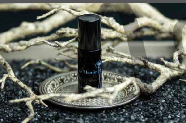
DE MAMIEL MAGICA ALCHIMIA PER CORPO E MENTE