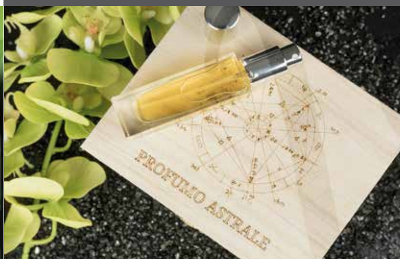
OLFATTIVA – IL PROFUMO DEL CIELO CHE CI HA VISTO NASCERE