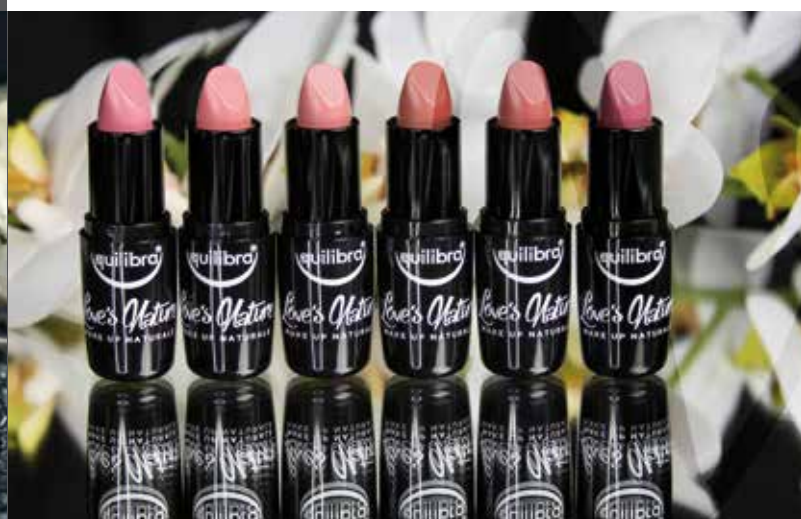
EQUILIBRA ROSSETTI LOVE'S NATURE