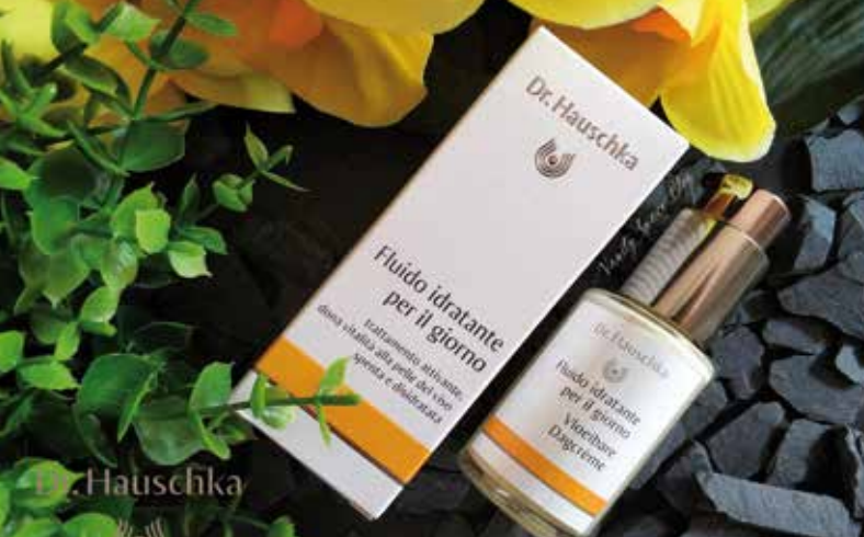
DR HAUSCHKA | FLUIDO IDRATANTE PER IL GIORNO