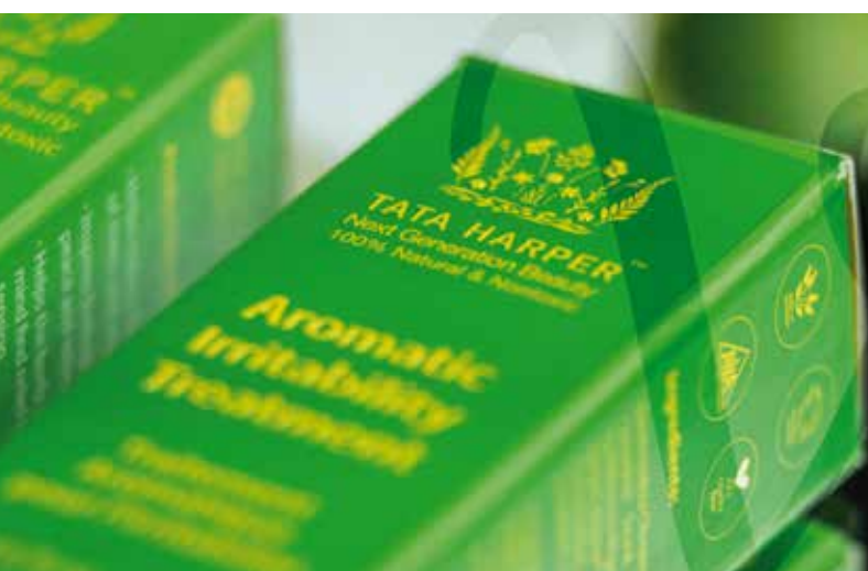
TATA HARPER POZIONI DI BELLEZZA PER LA NOSTRA ANIMA